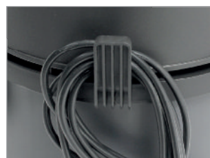
HAK NA PRZEWÓD