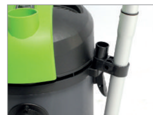
MIEJSCE NA RURĘ