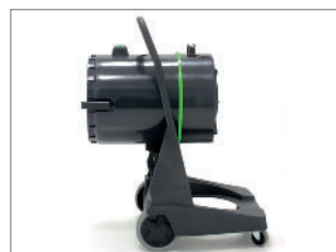
ZBIORNIK NA ZAWIASACH