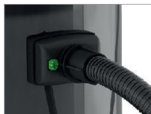
ŁATWE PRZYTWIERDZENIE WĘŻA DO KORPUSU