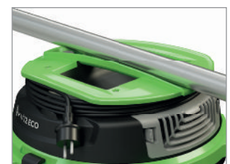
ERGONOMICZNY UCHWYT Z MIEJSCEM NA PRZEWÓD