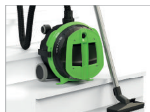
OPCJA ODKURZANIA SCHODÓW