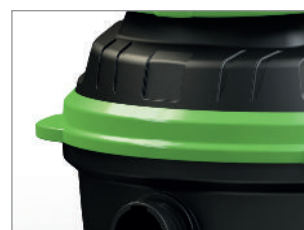
BOCZNA OCHRONA KORPUSU PRZED DRZWIAMI I ŚCIANAMI