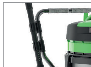
WÓZEK Z UCHWYTEM I KLIPSAMI NA RURĘ