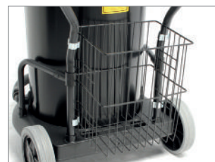
KOSZ NA AKCESORIA