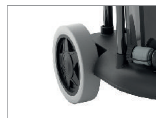
DUŻE KOŁA Z OPONAMI